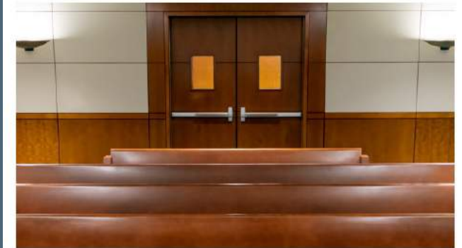
Zoom Background Image 1