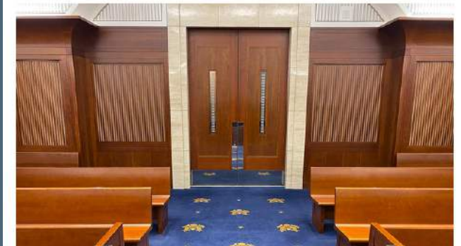
Zoom Background Image 2